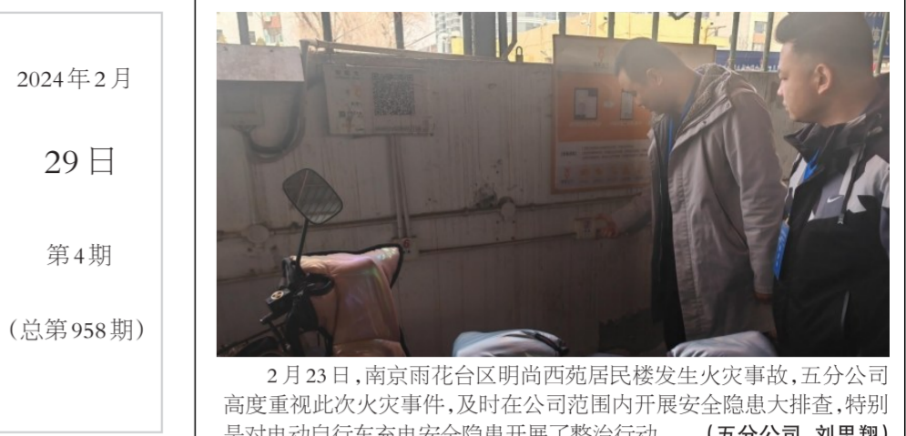
2月23日，南京雨花台区明尚西苑居民楼发生火灾事故，五分公司高度重视此次火灾事件，及时在公司范围内开展安全隐患大排查，特别是对电动自行车充电安全隐患开展了整治行动。(五分公司 刘思翔)

TAI YUAN GONG JIAO 太原公共交通控股(集团)有限公司主办 电话:0351-7772075 太原公交集团公众号