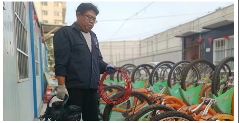
随着气温逐渐回升,为进一步提高服务质量,切实满足市民的出行需求,4月10日起,自行车公司开始了今年春季的“大保养”,为市民绿色出行提供切实保障。 (自行车公司 辛世雄)